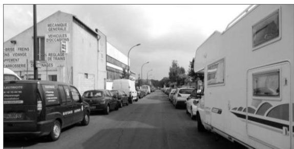
Photo avenue de Garlande un mardi, avec stationnement bilatéral toléré – Réalisation Sareco